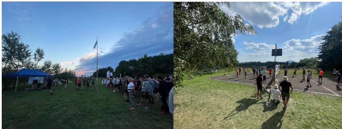
Záběry z nástupu a sportovního klání na SporTKiádě 2023 v Mukařově

Pracovníci služby poskytli klientům – vzhledem ke standardnímu typu služby s fixně stanovenou kapacitou klientů - standardní množství výkonů. Šlo především o tyto výkony: pracovní a skupinová terapie, individuální poradenství, vstupní vyšetření klienta, psychiatrické vyšetření, skupiny pro rodinné příslušníky a blízké klientů, rodinné poradenství. Stále zaznamenáváme vysoké počty výkonů výdeje především psychiatrické medicíny klientům.